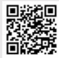
One Smart Control

Garantie Op het huisbesturingssysteem SlimWonen, zoals deze bij oplevering aanwezig was, zit een garantie van 2 jaar.